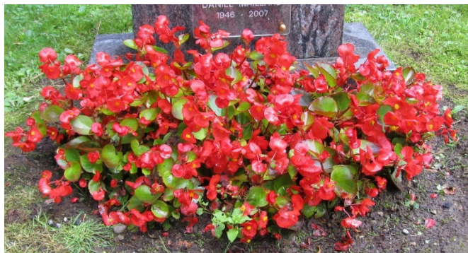
Schéma 1CC // bégonias