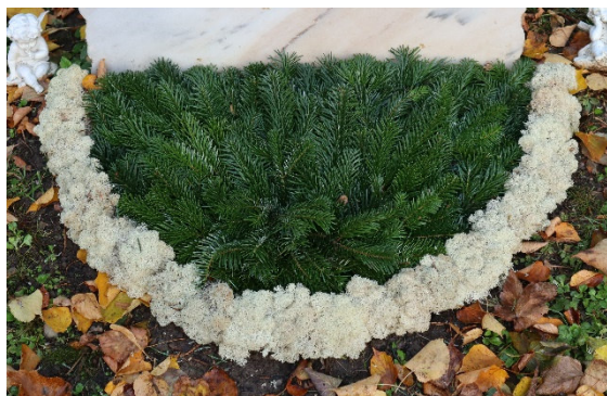
Schéma 3CC // sapin vert, bordure mousse