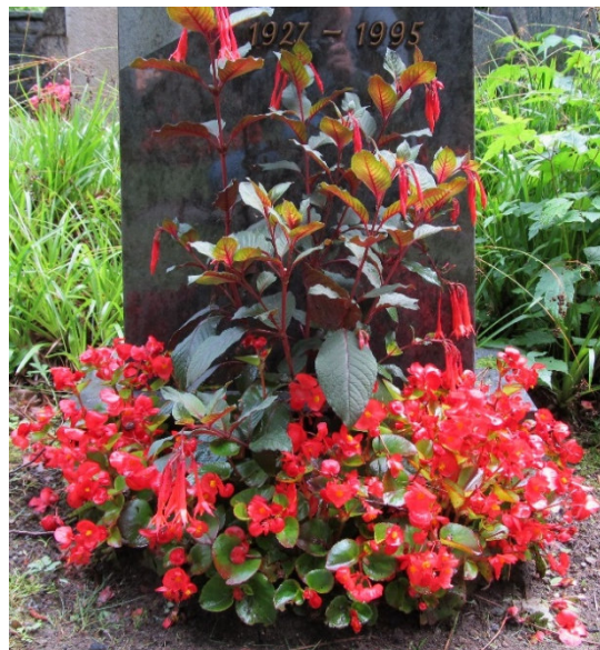
Schéma 2CC // bégonias et 1 fuchsia