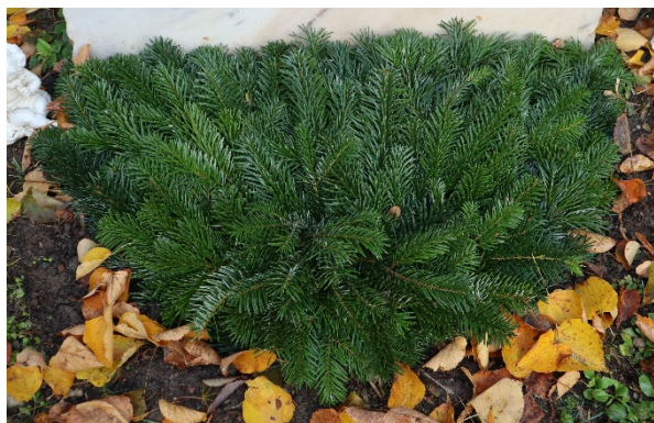
Schéma 1CC // sapin vert

Toussaint : une bruyère entre dans la composition de chaque schéma