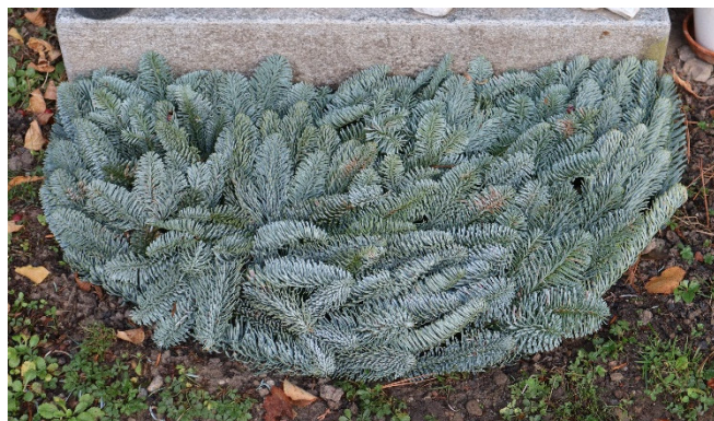
Schéma 2CC // sapin bleu