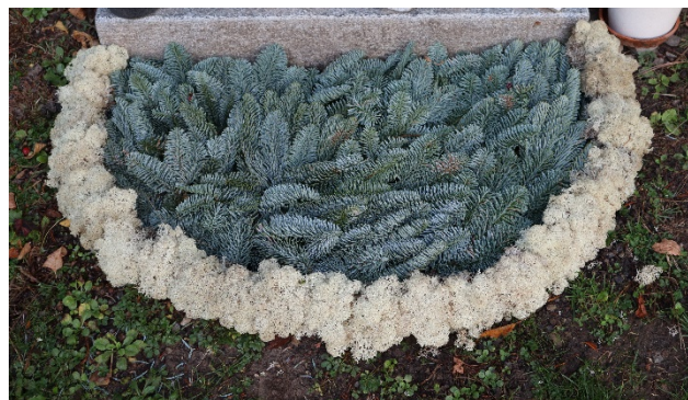
Schéma 4CC // sapin bleu, bordure mousse